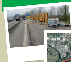
Barmen – Wichlinghausen