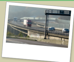
Westring – Sonnborner Kreuz