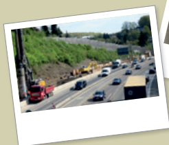
Katernberg – Elberfeld