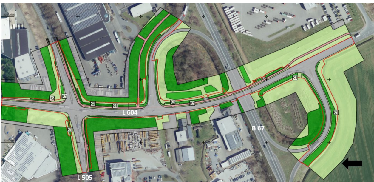
Abb.2: Bestand im Umbaubereich – Anpassungsbereiche des Straßenbauwerks = rot gerandet