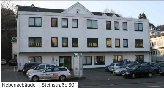
Nebengebäude - „Steinstraße 30“