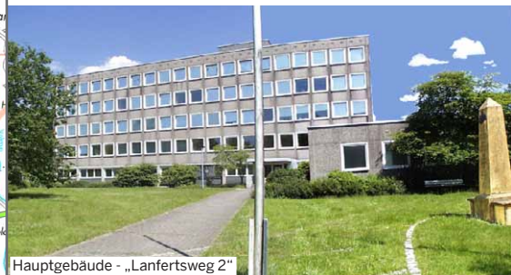
Hauptgebäude - „Lanfertsweg 2“

Telefon: 0291 298-0 Fax: 0291 298-223 Internet: www.strassen.nrw.de